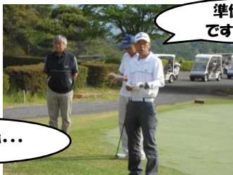
準備はいいですか~??