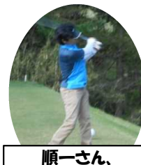
順一さん、調子はいかが?