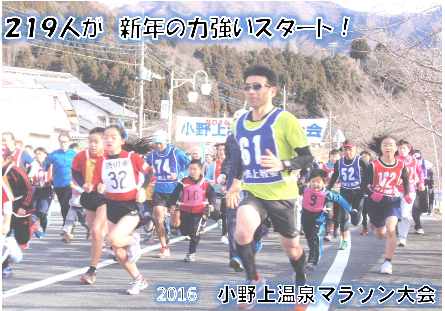
2016 小野上温泉マラソン大会

小野上温泉マラソン大会は、昭和45年9月1日に小野上村体育協会が設立したことから、年度内の事業に組み込まれました。