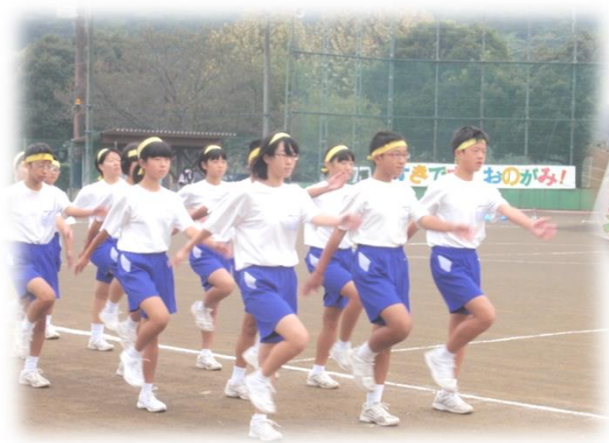
▲地区 & 中学校合同スポーツフェスinおのがみ