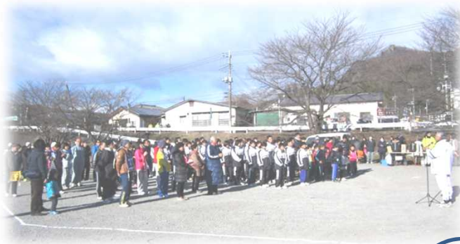
▲ 2016 小野上温泉マラソン大会