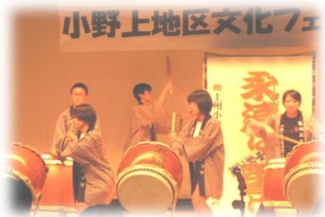
▲小野上地区文化フェスティバル